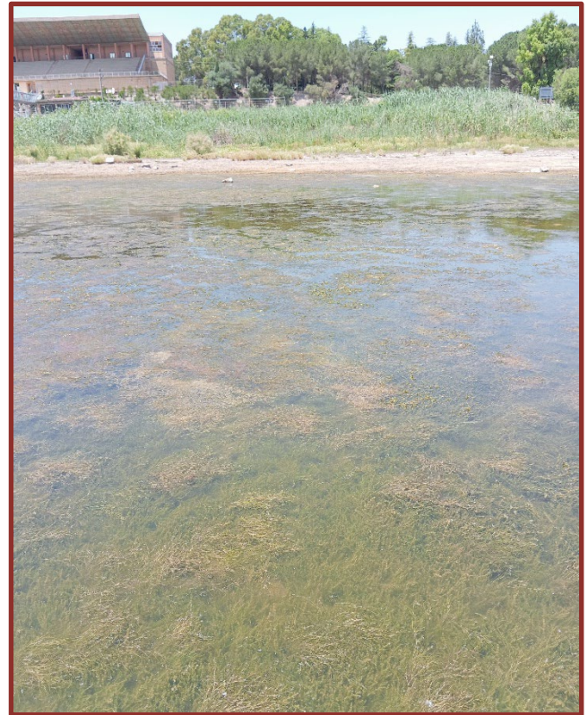
Figura 4. Il lago di Pergusa alla fine della primavera 2025 (10 giugno 2025), con il fondale ricoperto da una fitta vegetazione a Chara canescens e Ruppia maritima.

stati riscontrati (spiaggiati sulle porzioni di fondale ormai asciutte) resti di Chara canescens ! Purtroppo, da allora in poi il lago ha continuato a perdere acqua, arrivando a livelli minimi durante l'anno successivo (Figura 3). Finalmente nel 2025 il lago si è mostrato nuovamente pieno d'acqua e ricco di Chara canescens (Figure 4 e 5). Si è quindi potuto procedere ad effettuare alcuni campionamenti, che hanno riguardato vari aspetti: la vegetazione (analizzata con il metodo fitosociologico), la popolazione di C. canescens (verificando in particolare la presenza di individui maschili e femminili, facilmente distinguibili in presenza degli organi riproduttori, rispettivamente anteridi e oogoni), ma anche il suolo e l'acqua per ulteriori indagini riguardanti la banca delle spore nei sedimenti, aspetti microbiologici etc. Dalle indagini di campo preliminari, svolte lungo due profili in due diverse aree del lago, la popolazione di Chara sembra costituita solo da individui femminili, quindi sembrerebbe