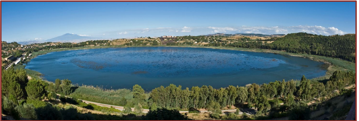
Figura 1. Vista panoramica del lago di Pergusa, sullo sfondo a sinistra l'Etna (luglio 2010).

naturali di Sicilia. Situato al centro dell'isola, nei pressi di Enna, a una quota di circa 667 metri slm, è noto fin dall'antichità classica per il mito di Kore/Proserpina, rapita da Ade/Plutone re degli Inferi, ricordato nelle Metamorfosi di Ovidio (I secolo d.C.) e nel ratto di Proserpina di Claudiano (IV secolo d.C.).