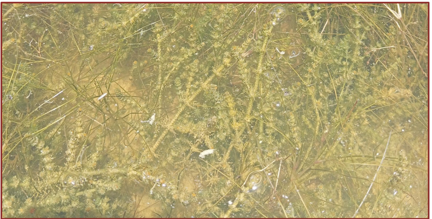
Figura 5. Dettaglio della vegetazione a Chara canescens (al centro della foto) e Ruppia maritima.

innanzitutto quella di trasferire informazioni ed esperienze derivanti dal progetto agli stakeholder , per evitare che la conoscenza rimanga confinata agli studiosi e alle accademie, ma diventi invece supporto utile alla gestione dei siti, evidenziando l'importanza di questa specie e di queste popolazioni sessuali. Ma il rapporto con gli stakeholder risulta doppiamente virtuoso poiché bidirezionale: dagli stakeholder stessi possono arrivare esperienze, problemi e suggerimenti che possono essere utili al progetto e contribuire alla definizione di pratiche di conservazione più efficaci. Oltre all'azione locale è prevista quindi un'azione transnazionale, per cui gli stakeholder dei siti in cui sono (o erano) presenti popolazioni sessuali di Chara canescens sono entrati a fare parte di una rete internazionale: un primo incontro online è servito a porre una base comune e un primo contatto, mentre un incontro finale servirà a consolidare e formalizzare meglio la rete transnazionale, anche ai fini della elaborazione e della attuazione di linee guida per la gestione dei siti che ospitano, hanno ospitato o potrebbero ospitare popolazioni sessuali di Chara canescens . Fine ultimo del progetto