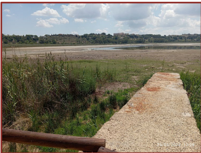
Figura 3. Il lago di Pergusa durante la fase siccitosa dell'estate 2024 (23 agosto 2024).

Quando alla fine dell'estate del 2023 è stato svolto un ulteriore sopralluogo nell'ambito del progetto ProPartS, all'inizio di un periodo di siccità, sono